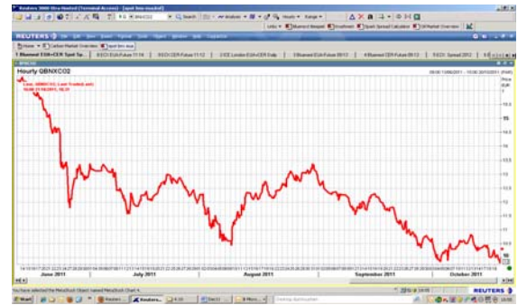
EUA Spot 13.06.2011 – 20.10.2011